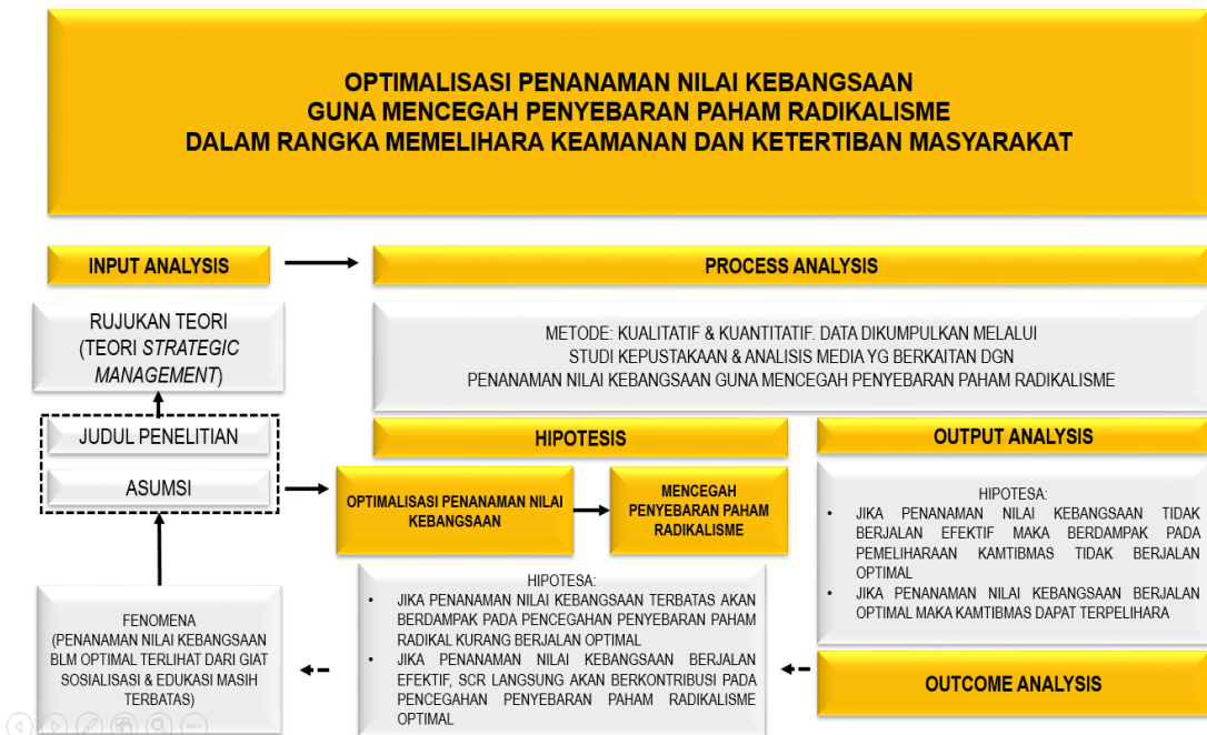
Gambar 2.1 Kerangka Berpikir

Landasan konseptual dalam penelitian NKP ini dibangun untuk menjelaskan kerangka berpikir mengenai optimalisasi penanaman nilai kebangsaan, sebagai berikut: